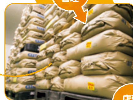
園田商事株式会社 専務取締役 高橋 久夫様